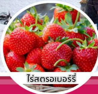
ไร่สตรอเบอร์รี่