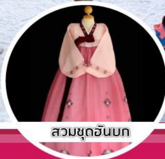
สวมชุดฮันบก