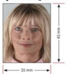
รูปถ่ายมาตรฐาน