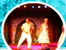
การแสดงพิเศษ ยามค่ำคืน