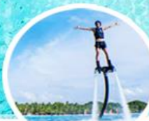
กิจกรรมทางน้ำ