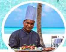
เมนูอาหารสุดพิเศษ