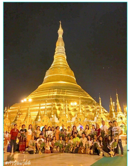
#การท่องเที่ยว

อายุกว่าสองพันห้าร้อยกว่าปี มหาเจดีย์ที่ใหญ่ที่สุดของประเทศพม่า มีความสูงถึง 326 ฟุต สร้างโดยพระเจ้าโองกะลาปะ เมื่อกว่า 2,000 ปีก่อน มหาเจดีย์ชเวดากองมีทองคำโอบหุ้มอยู่เป็นน้ำหนักถึง 1100 กิโลกรัม ยอดฉัตรประดับประดาด้วยเพชรพลอยอัญมณีล้ำค่า กว่า 5,548 เม็ด รวมถึงทับทิม ขนาดเท่าไข่ไก่บนยอดองค์พระเจดีย์ชเวดากอง เป็นลานกว้างรองรับแรงศรัทธาของ พุทธศาสนิกชนได้จำนวนมาก บริเวณทางขึ้นทั้งสี่ทิศจะมีวิหารโถงสร้างด้วยเครื่องไม้หลังคาทรงปราสาทปิดทองล่องชาดประดับกระจกทั้งหลาย ภายในประดิษฐานพระประธานสำหรับให้ประชาชนมากราบไหว้บูชา เพราะชาวมอญและชาวพม่าถือการกราบ