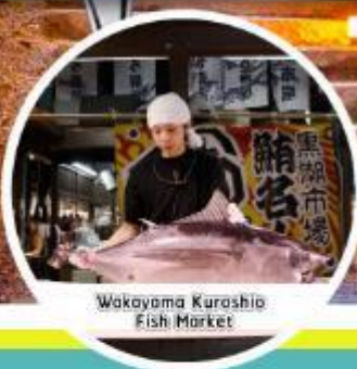
Wakayama Kurashio Fish Market